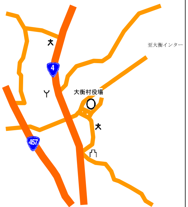
村 役 場 案 内 図 【 JR 東 北 新 幹 線 仙 台 駅 下 車、バ ス 50 分 】

支 所 ・ 出 張 所 数 | 支 所 | 一 箇 所 | 出 張 所 | 一 箇 所